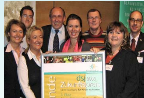
Karower Dachse mit Vertretern der Sportjugend

Die bestehenden Unwägbarkeiten und Risiken sind weder den Landessportjugenden als Träger des Freiwilligen Sozialen Jahres noch den Sportvereinen als Einsatzstellen für die jungen Menschen zumutbar. Sie sind in ihrer Wirkung kontraproduktiv und werden dazu führen, dass viele