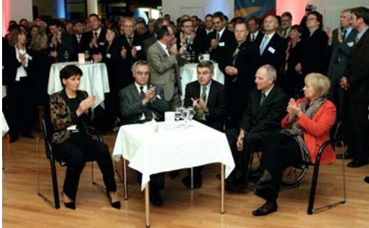
Sport trifft Politik - gute Tradition, viel Gesprächsstoff

Parlamentarischer Abend des Sports am 11. November 2008