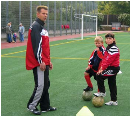
Schönstes Geburtstagsgeschenk: neuer Kunstrasen