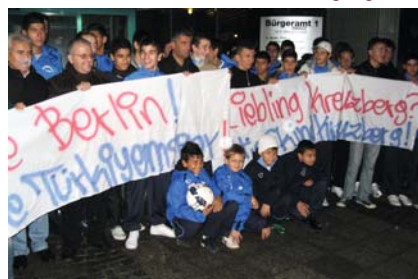
Protest vorm Kreuzberger Rathaus