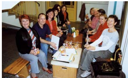
Ideen sammeln bei Fortuna Marzahn