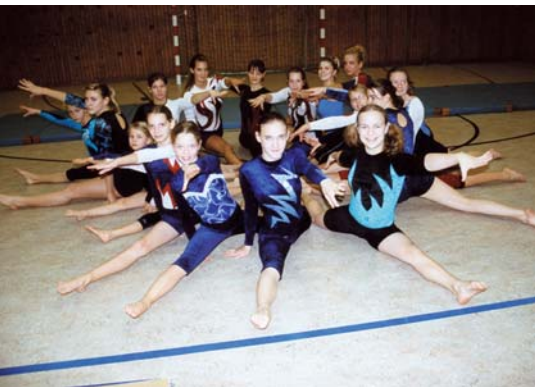
Beim TSV Wittenau laufen die Vorbereitung auf Hochtouren

T SV Wittenau: 2300 Mitglieder, 17 Abteilungen. Schauplatz der Familien-Sportmesse ist der Turnhallenkomplex der Bettina-von-Arnim-Oberschule, Senftenberger Ring (Märkisches Viertel).