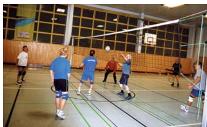
Auch die Volleyballer wollen dabei sein