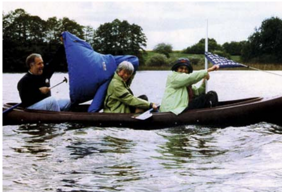
Zurück von einer Kanutour

Erinnerungsstücke, Medaillen oder Urkunden, die von einer Teilnahme an nationalen oder internationalen Meisterschaften künden, gibt es keine. Dafür nehmen wir mit einem Blick auf die Höhepunkte 2007 davon Kenntnis, dass am 6. Mai die Frühjahreswanderung im Kalender steht, am 9. Juni die Kanu-, am 29. Juli die Fahrradwanderung, am 18. August die Frauen-Stammtisch- sowie am 14. Oktober die Pellkartoffel- und Heringsfahrt. Aus der Vereinszeitung erfährt man auch, dass die erste Tortenstücken-Wanderung 1991 an den Müggelsee führte und die 16. im April vergangenen Jahres nach Königswusterhausen.