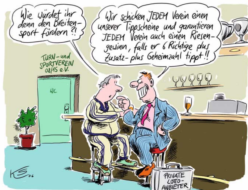
Karikatur: Klaus Stuttmann