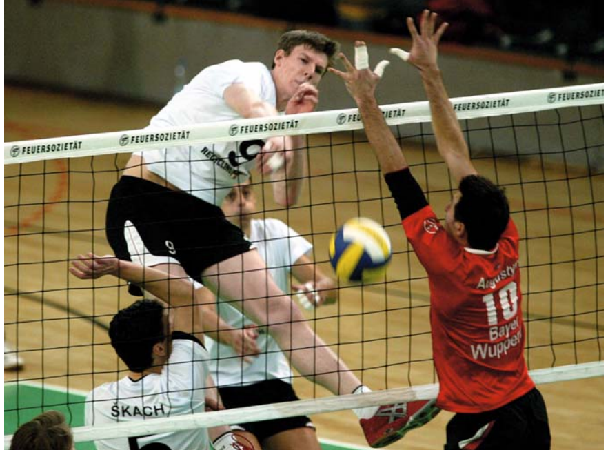
In der Bundesliga spielen die Männer des SCC vorn mit, z.Z. auf Platz drei. International haben sie sich mit einem Sieg aus dem Europapokal verabschiedet. Der 3:0-Erfolg über OK Karlovac/Kroatien konnte im Dezember das Aus nicht verhindern.