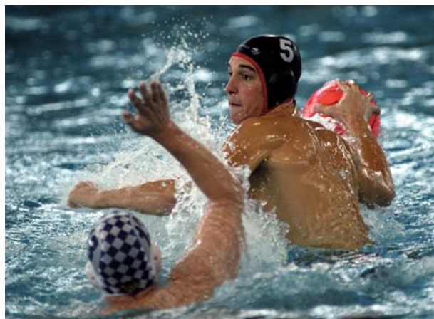
Die Wasserfreunde Spandau 04 sind im Achtelfinale der Len-Trophy ausgeschieden und mussten ihre internationalen Ambitionen für diese Spielzeit ad acta legen. Jetzt gilt es national auf dem Vormarsch zu bleiben. In der laufenden Spielzeit ist Spandau noch ungeschlagen.