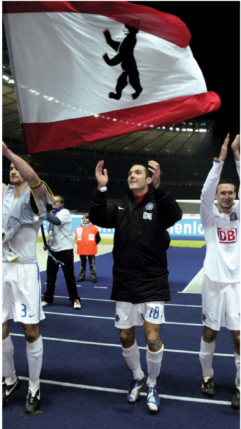
Jubel bei Hertha BSC: Die Mannschaft geht auf dem 5. Bundesliga-Platz in die Winterpause.