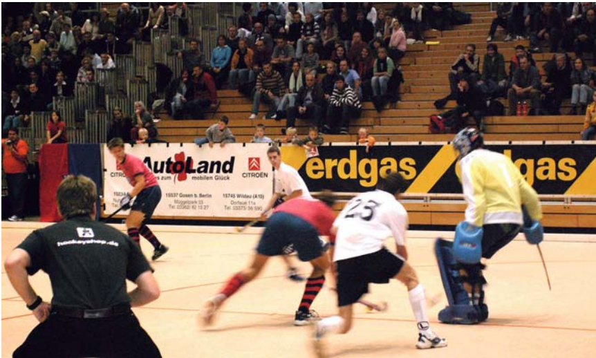
D ie Hockey-Fans erlebten am ersten Dezemberwochenende ein 16-Stunden-Feuwerk. Zum dritten Mal fand im Horst-Korber-Sportzentrum der GASAG-Berlin-Spieltag statt. Der Hockey-Verband organisierte elf Bundesligapartien ohne Laufereien von einer Halle zu nächsten.