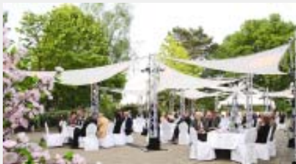
Festveranstaltung im Haus des Sports

M it einem feierlichen Festakt beging die Sportjugend Berlin am Mittwoch, dem 15. Mai 2013 das 100-jährige Jubiläum des heutigen Jugendferienparks Ahlbeck im Haus des Sports in der Jesse-Owens-Allee. Am Pfingstsonntag gestaltete sie dann einen Aktionstag für Interessierte auf der Insel Usedom. Zu beiden Anlässen empfing der Vorstand der Sportjugend zahlreiche Gäste aus Politik und Sport.