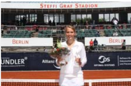
Vorjahressiegerin Antonia Lottner

gebühr bei Online-Buchung). Im Internet auf www.istaf.de oder unter Tel. 030/20 60 70 88 99 gibt es viele weitere Angebote für ein günstiges Sporterlebnis für die ganze Familie.