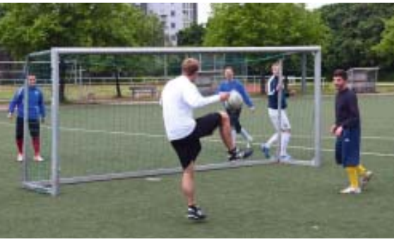
Die erste Herren-Mannschaft des 1. FC Schöneberg trainiert dreimal pro Woche.