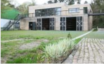
Neubau: Bootshaus der Ruder-Union Arkona an der Scharfen Lanke