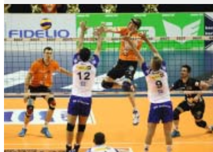
Auch die Volleys verteidigen den Titel.

werden. Die Beispiele, wo damit auf einem Sockel aus Engagement, Kreativität und leidenschaftlichem Einsatz aufgebaut werden konnte, sind echte Mutmacher.“ Und deshalb habe das Programm auch noch wie vor und immer noch seine Berechtigung. „Wir wollen nicht nur den 50. Jahrestag 2019 feiern, sondern es noch länger weiterführen“, sagt der als Ex-Gewichtheber aus einer der Sportarten kommende Funktionär, die die Existenz der Bundesliga-Hilfe zu schätzen wissen. Hunderte Vereine haben seit 1969 davon profitiert – und der Berliner Sport insgesamt auch, der damit bunt geblieben ist und auf wunderbare Weise zur lebendigen Metropole passt. Senat und Lotto haben einen großen Teil dazu beigetragen, „dafür müssen wir echt dankbar sein“. Jahr für Jahr gibt es im Triumvirat mit dem LSB eine Abstimmung, in der die mitunter durchaus divergierenden Positionen in Einzelfragen auf einen gemeinsamen Gesamtnenner gebracht werden. Auf die Idee, die Bundesliga-Hilfe generell abzuschaffen, ist dabei noch keiner gekommen. Gut so!