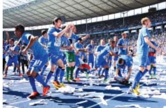
Was für eine Saison! Hertha feiert frenetisch den Aufstieg.

Dass mit der Bundesliga-Hilfe die allgegenwärtigen Probleme nicht aus der Welt zu schaffen sind, ist ihm klar. „Das ist Hilfe zur Selbsthilfe, und so sollte es auch verstanden