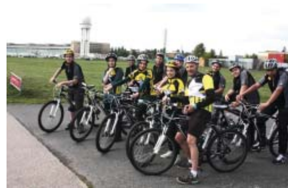
Training auf dem Tempelhofer Feld

Art Anschubfinanzierung eines Projekts bedeutete, das sich unter dem Begriff „Integration durch Radsport“ einordnen lässt. „Wir wollen Schüler und auch Schülerinnen mit Migrationshintergrund zum Radsport bringen“, sagt Kowalewsky.