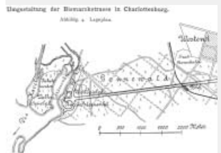
Plan von L. Hercher für die Umgestaltung der Bismarckstraße

Werbemarke zur Einweihung des „Deutschen Stadions“ im Grunewald am 8.6.1913