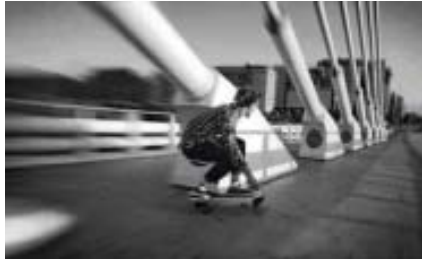
Boarding in der Stadt

Sehr innovativ und entspannt zugleich ging es