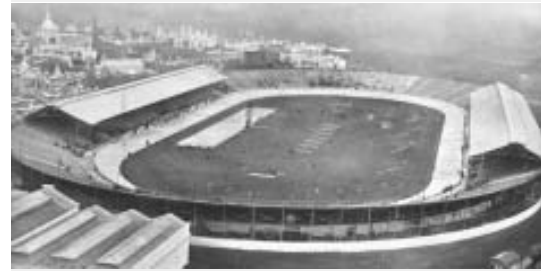
Londoner Olympiastadion 1908 mit einer Schwimmbahn auf dem Rasenplatz