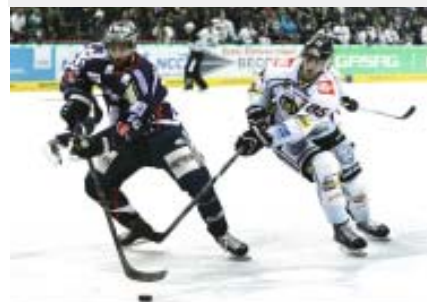
Eisbären sind wieder Deutscher Meister.