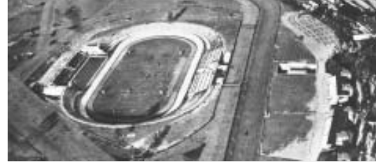
Das Berliner „Olympiastadion“ (Deutsches Stadion) für 1916 mit einer Schwimmbahn im Zuschauerbereich