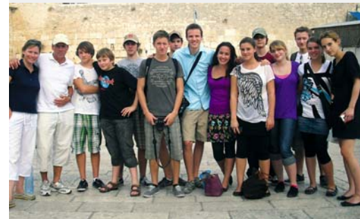
Wir fahren nach Jerusalem und wer fährt mit? Die Frage stellte sich, als die Einladung für eine Jugendgruppe nach Jerusalem beim LSB eintraf. Schon seit 1969 gibt es den Jugendsportaustausch Berlin-Jerusalem. Diesmal hatten Fechtlersportler die Möglichkeit, denn im Jahr zuvor waren Fechter aus Jerusalem beim FC Grunewald zu Gast. Die Jugendlichen aus beiden Städten hoben im Abschlussgespräch insbesondere die intensiven Freundschaften hervor, die auch bei diesem Besuch entstanden sind, bzw. vertieft wurden, und versprachen sich gegenseitig, weiterhin in engem Kontakt zu bleiben. Dieter Bergmann, FC Grunewald

erreicht als durch pedantisches Planen.“ Und er hält es mit Einstein: Phantasie sei wichtiger als Wissen. Eigentlich eine paradoxe Aussage für einen Mann, der gewisse Vorstellungen hatte, was zu tun sei, um etwas Besonderes zu erreichen. Egal ob es sich um die Eliteschulen des Sports, Kooperationen mit Hoch- und Fachschulen oder Arbeitsplatzbeschaffung handelte, um den Athleten beste Voraussetzungen zu schaffen.