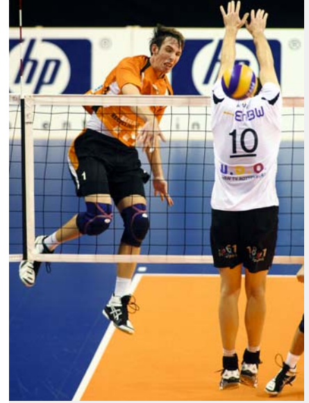
Sie können noch zulegen, die SCC-Volleyballer: in der Bundesliga, im DVV-Pokal und im europäischen Challenge Cup.

Er kennt alle, die in Berlin etwas im Sport zuwege brachten. „Ich habe immer einen guten Draht zu den Athleten und ihren Trainern gehabt“, erklärt Zinner, der gern den Satz zitiert, dass man „durch Leidenschaft mitunter mehr