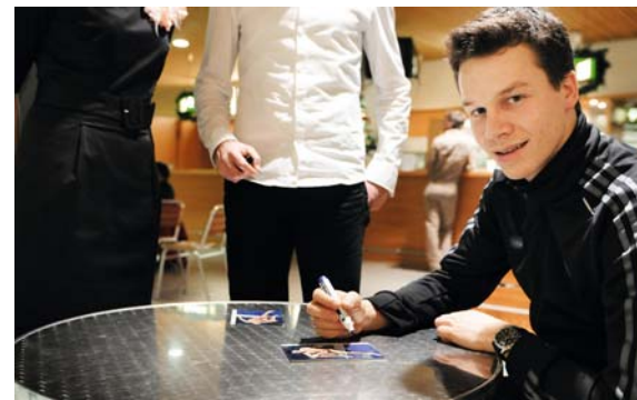
Patrick Hausding bei seiner Autogrammstunde anlässlich der Enthüllung der Ehrentafeln