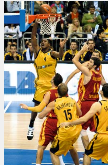
Die Basketballer von Alba bieten in der O2 World Spitzensport.