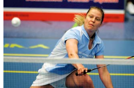
Die Badmintonspieler der SG Empor Brandenburger Tor sind ein starkes Team: Im letzten Heimspiel vor der Weihnachtspause 5:3-Sieg gegen Refrath und Platz 3 in der Bundesliga.

Welche speziellen Angebote sind nötig, um erfolgreich gegen kommerzielle Fitness-Center zu bestehen?